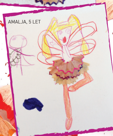
AMALJA, 5 LET