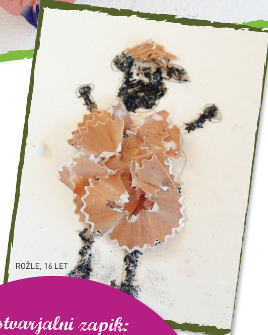
ROŽLE, 16 LET